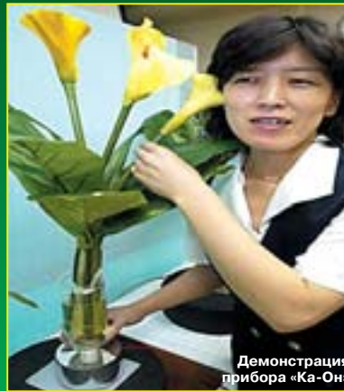
Демонстрация прибора «Ка-Он»

ировали и уже запустили в продажу хитроумное устройство, которое даёт возможность познакомиться с музыкальным творчеством любых комнатных растений. Достаточно поместить этот компактный прибор размером в чайное блюдце под донышко цветочного горшка и присоединить провода к музыкальному центру или телевизору, и из динамика зазвучит оригинальная мелодия. Электронный преобразователь называется «Ка-Он», что значит «звук цветка». Самая приятная музыка у растений с жестковатыми и не слишком мясистыми листьями, а на первом месте стоят лилии и нарциссы. Как считают исследователи, в принципе можно заставить музицировать любые растения, фрукты, овощи, ягоды и даже отдельные травинки.