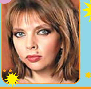
Полосу подготовила Наталья Михайловская

сбылось: любимая работа, любящий муж. Но, видимо, чего-то недоглядела гадалка в черноте кофейной гущи: не то что троих, даже одного ребёнка Бог Кате не дал. Десять лет, десять долгих, мучительных лет ходили они с мужем по врачам, пили таблетки, педантично выполняли все рекомендации — забеременеть Катя так и не смогла. Доктора поначалу лишь разводили руками, а потом и вовсе вынесли страшный приговор: «бесплодие». Но вот случилось Екатерине оказаться по работе в Индии. «Слушай, там, говорят, в горах гуру один живёт, так вроде бы он любое желание может исполнить. Попробуй его найти, а вдруг...» — посоветовала Екатерине перед поездкой подружка.